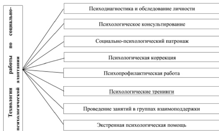
Рисунок 1 – Технологии по социально-психологической адаптации

Психосоциальную работу по социально-психологической адаптации подопечных психологи и социальные работники стационарных учреждений строят на следующих методах и технологиях (рисунок 1).