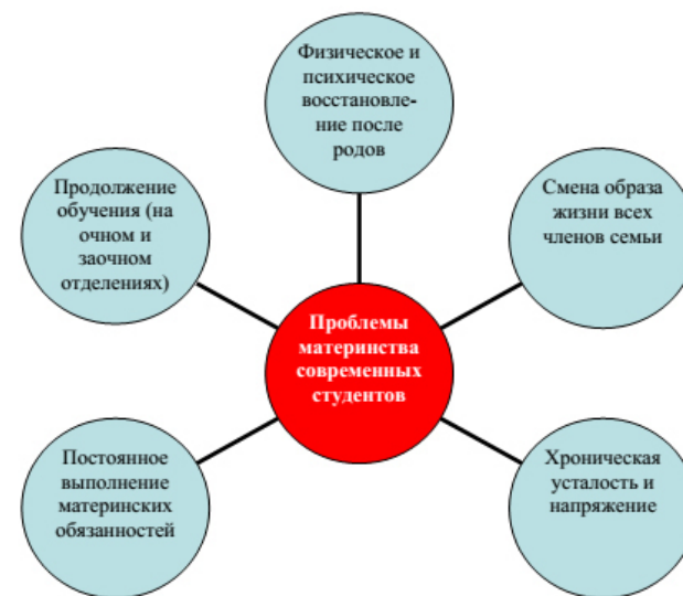
Рисунок 1 – Проблемы молодых мам после рождения ребенка

Итак, изучив понятия «материнство» и «психологическая готовность», а также выделив трудности мам, являющихся студентками в современных условиях, мы хотели бы отобразить проблемы молодых мам после рождения ребенка в рисунке 1.